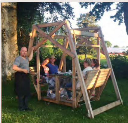
Fikapaus i en av Gotlandsgungorna