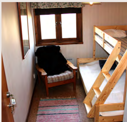
Litet familjerum hus Nybygget