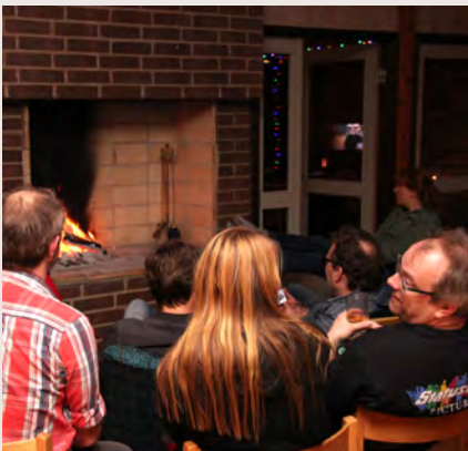
Barhäng vid spisen