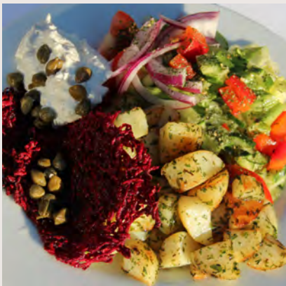
Vegetarisk a la carte