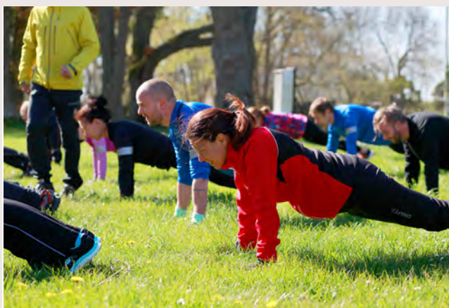
Träningscamp på Ekegården. Gott om öppna ytor