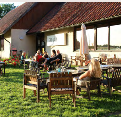
Uteservering med gott om möbler