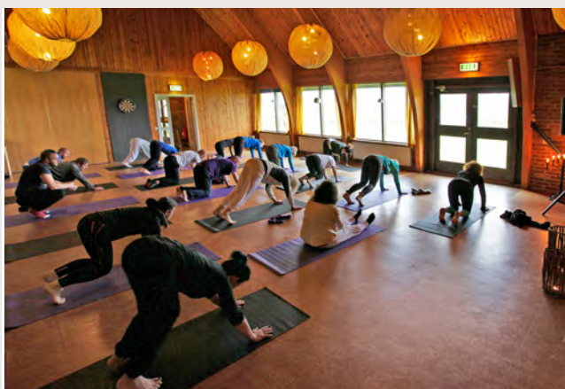
Yogagrupp hörsal inomhus