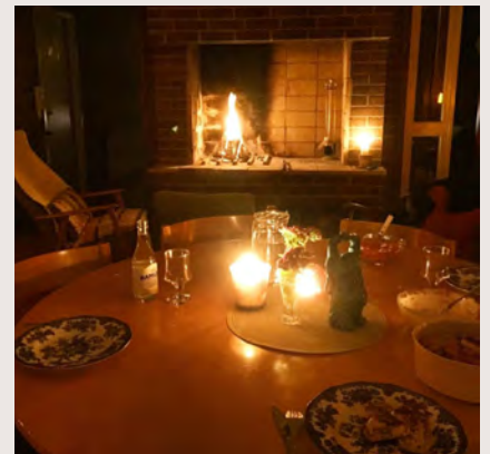
Måltid vid öppna spisen