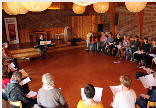
Körgrupp i hörsalen. Kyrktaket ger en fantastisk akustik