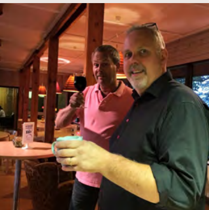
Samtal kring ståborden