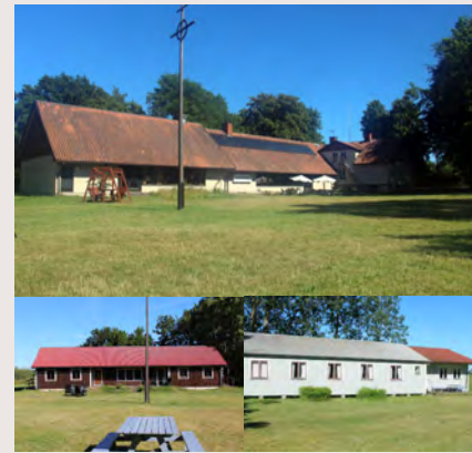
Huvudbyggnad högst upp. Hus Nybygget ner till vänster. Hus Gräslöken ner till höger