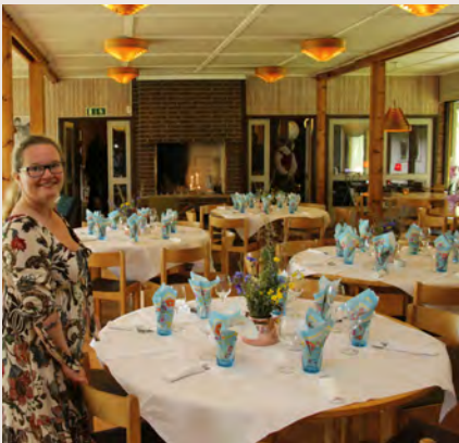
Dukat för buffé

Finns det barn eller särskilda önskemål kring mat på andra tider så har alla boende tillgång till gårdens separata kök och uppehållsrum.