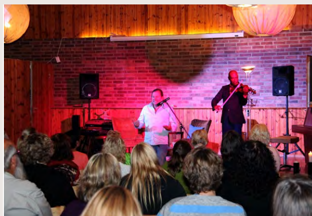
Föreläsning & konsert